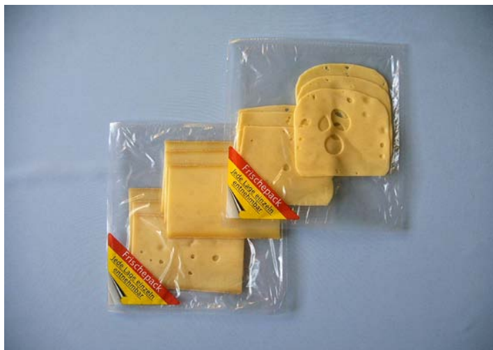
Obr. č. 3: Příklady balení vícevrstvého balení MLP

Pro samotné obchodní řetězce s vlastní výrobou přináší tato unikátní technologie MLP vícevrstvého balení možnost balit čerstvé nářezy pro jednotlivé filiálky centrálně. Toto vše se děje racionálně a pod