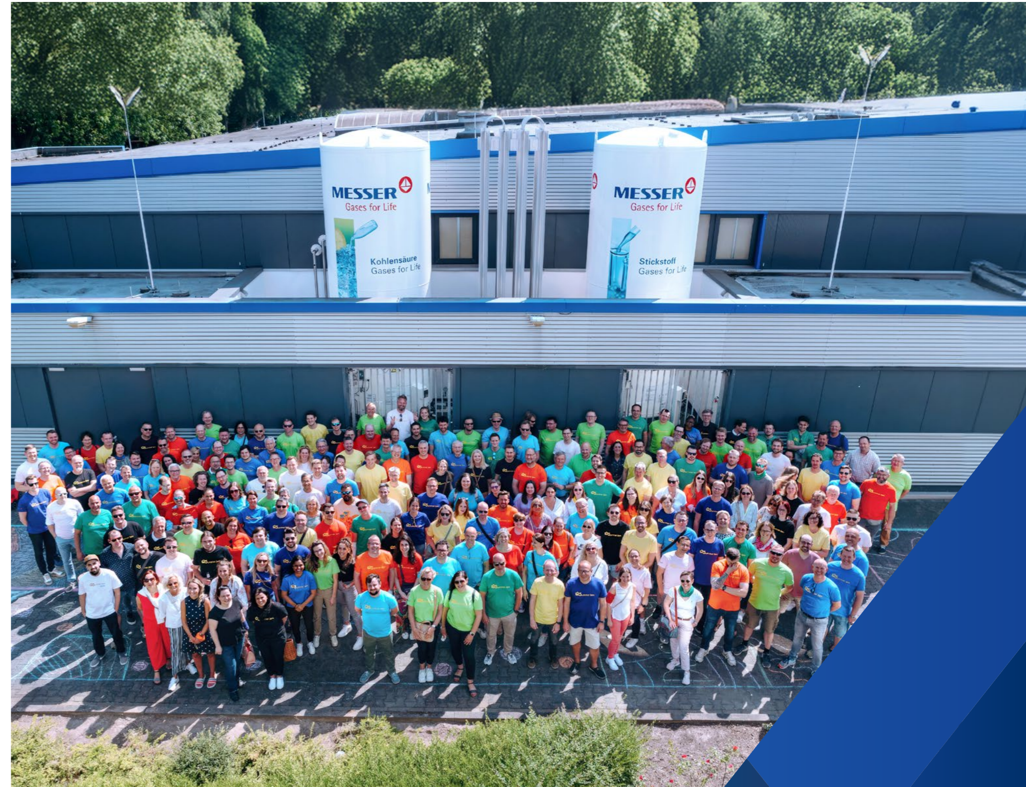
Messer in Deutschland

Die globale Erwärmung und der Wandel hin zu einer dekarbonisierten Wirtschaft können beispielsweise Umweltrisiken wie höhere Versicherungsprämien, poten-