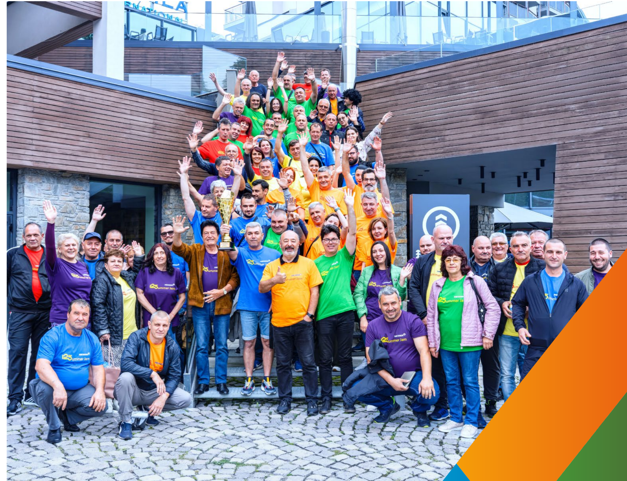
Messer in Bulgarien und Nordmazedonien

Messer erweitert sein Angebot an kundenorientierten digitalen Tools kontinuierlich. Damit werden Routinen vereinfacht, Arbeitsprozesse erleichtert oder zielgerichtete Informationen geliefert. Beispiele dafür sind die E-Services, die Messer seinen Kunden anbietet. Sie reichen von Bestellung/Nachbestellung, Lagerverwaltung und Rechnung über produkt- bzw. anwendungsspezifische Informationen bis hin zu Anwendungen, über die Feedbacks und technische Fragen behandelt werden können. Darüber hinaus werden digitale Technologien für die optimierte Kundenversorgung genutzt.