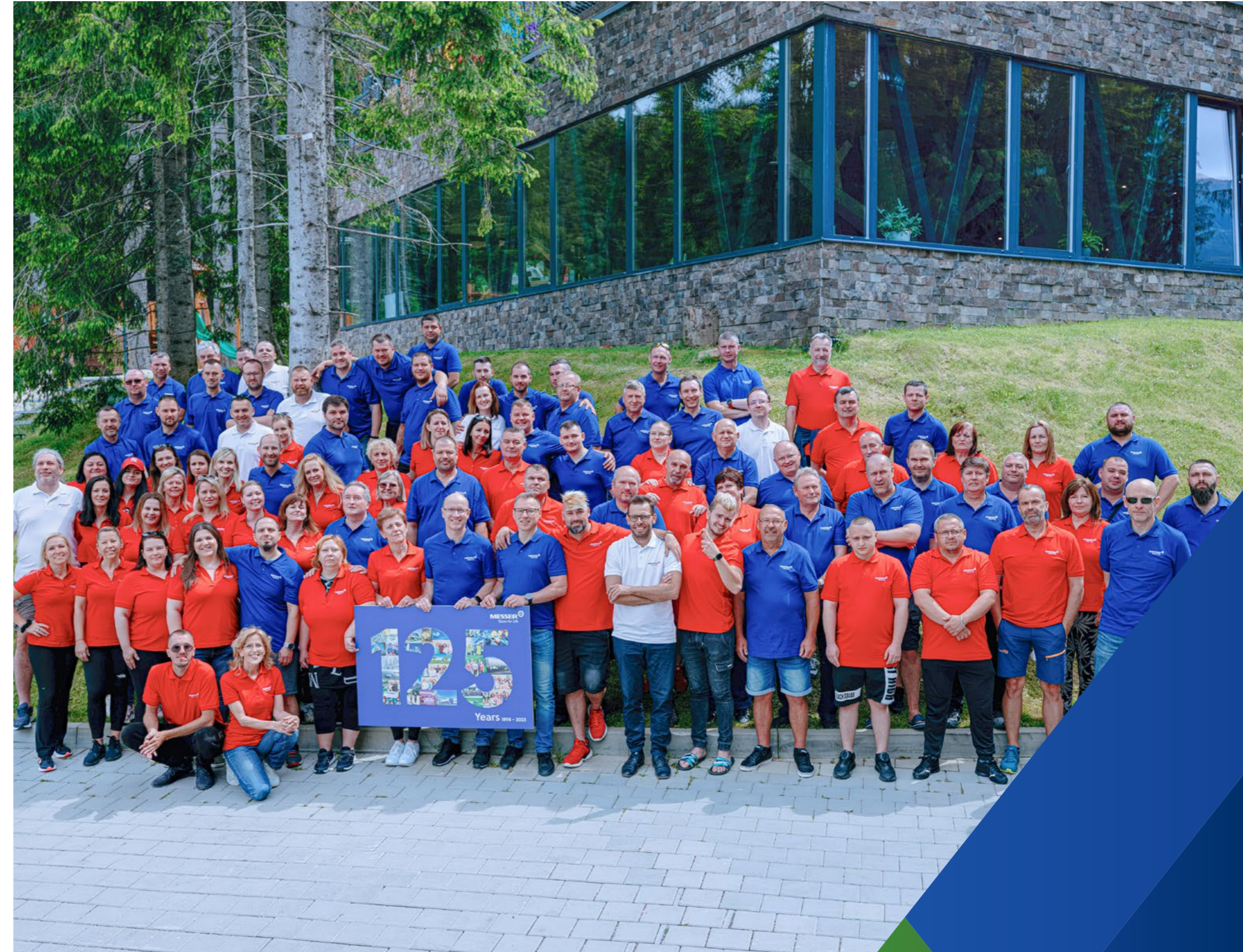
Messer in der Slowakei

Unsere Wesentlichkeitsmatrix spiegelt die Wichtigkeit der Themen Arbeitssicherheit und Gesundheit wider. Dazu gehören die Förderung der Sicherheit derer, die unsere Produkte anwenden, die Einhaltung sicherer Praktiken in unserer gesamten Lieferkette sowie die Pflege einer Kultur der Sicherheit, der Gesundheit und des Wohlbefindens. Diese Themen sind in unserem Unternehmen, ebenso wie in unserer Branche, fest verankert.