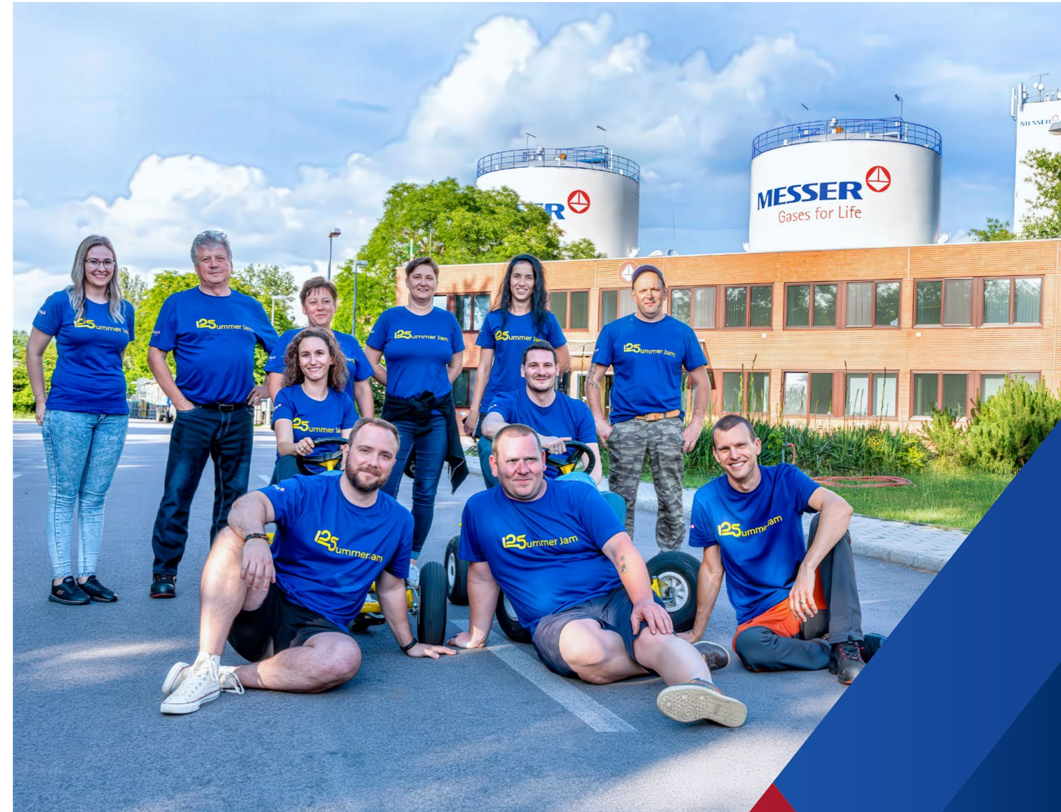
Messer in Ungarn

Mittelfristig erwarten wir Steigerungen bei Umsatz und Ergebnis. Nachhaltigkeit, Kundenorientierung und -zufriedenheit, Effizienz, Teamarbeit und profitables Wachstum gehören zu den obersten Prioritäten von Messer.