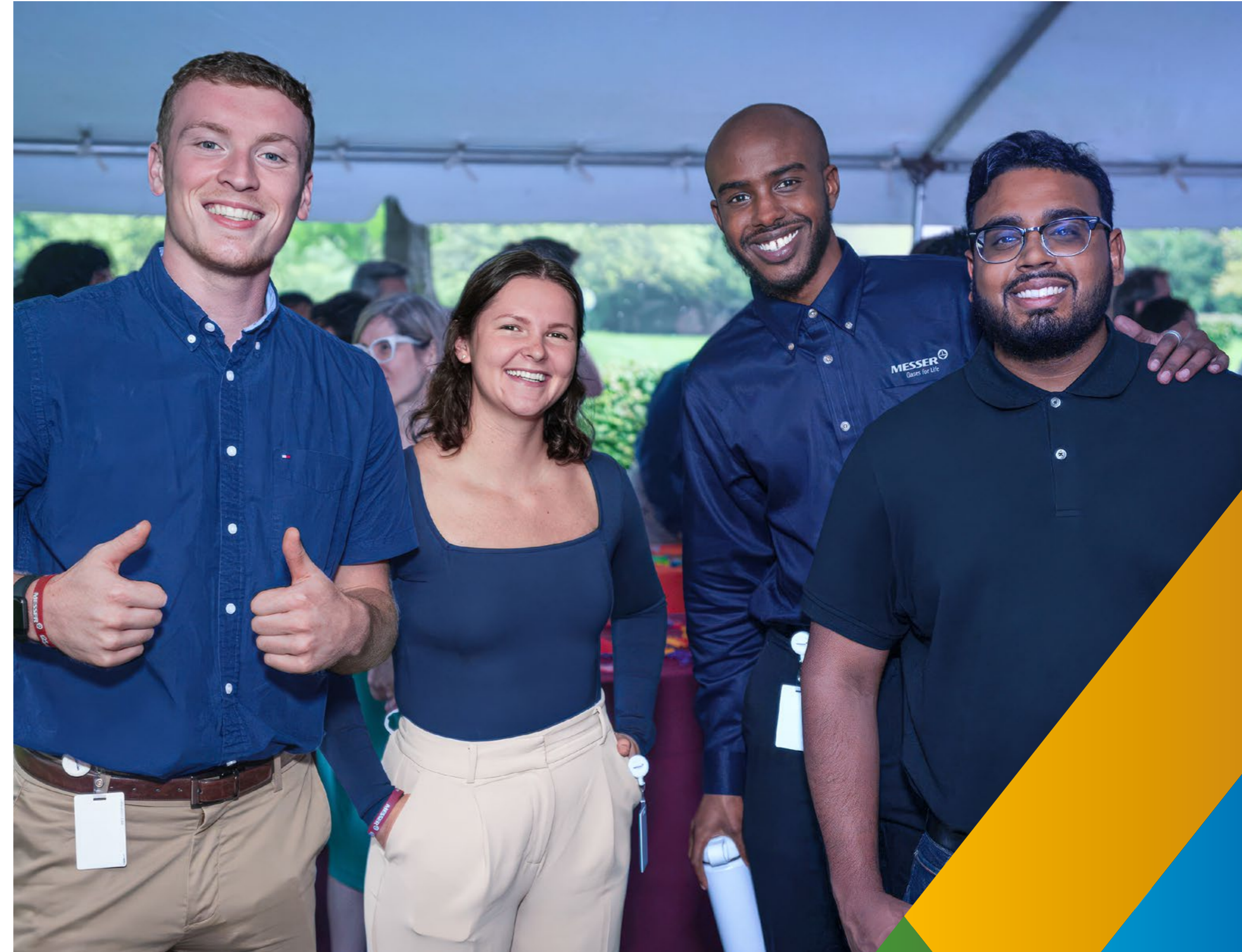
Messer in den USA

Luft ist ein Gasgemisch, das hauptsächlich aus Stickstoff (78 %), Sauerstoff (21 %) und dem Edelgas Argon (0,9 %) besteht. Die restlichen 0,1 % setzen sich hauptsächlich aus Kohlendioxid und den Edelgasen Neon, Helium, Krypton und Xenon zusammen. Ein wesentlicher Teil unseres Geschäfts sind Luftgase. Luft wird üblicherweise durch Destillation in Luftzerlegungsanlagen mit Tieftemperaturrektifikation in ihre Bestandteile zerlegt. Dieser Prozess ist vollständig elektrifiziert und unser Energiebedarf ist daher erheblich. Wir überwachen und steuern den Stromverbrauch und die Stromquellen für unseren Produktionsprozess sorgfältig. Die Zerlegung von Umgebungsluft verursacht keine toxischen oder umweltgefährdenden Emissionen, selbst bei einem Stillstand oder einer Betriebsunterbrechung. Der größte Teil unserer Treibhausgasauswirkungen entsteht daher durch den von uns verbrauchten Strom (Scope 2).