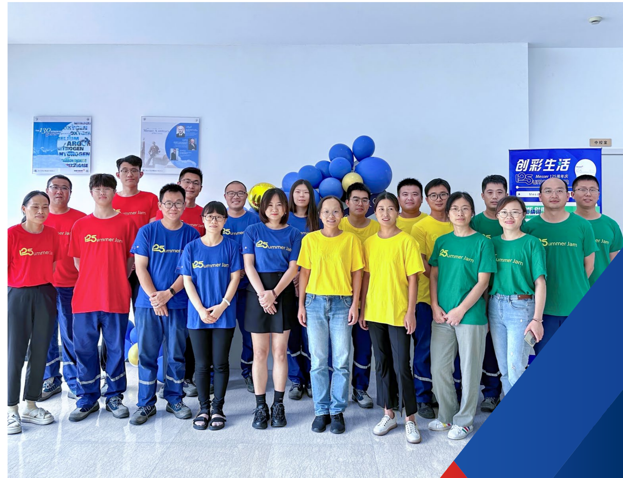
Messer in China

Als Mitglied der Charta der Vielfalt befolgt Messer die nationalen und internationalen Bestimmungen für Menschenrechte und die allgemeinen ethischen Grundsätze gegen Kinder- und Zwangsarbeit. Die Achtung der Menschenrechte und die Wahrung fairer Arbeitsbedingungen bilden die Grundlage unserer Unternehmensphilosophie und Geschäftsprozesse. Messer ist der Ansicht, dass jeder Mitarbeitende Anspruch auf faire Behandlung, Höflichkeit und Respekt hat. So erwarten wir von jedem Mitarbeitenden, dass er alle Personen auf respektvolle, faire, freundliche und professionelle Art behandelt.