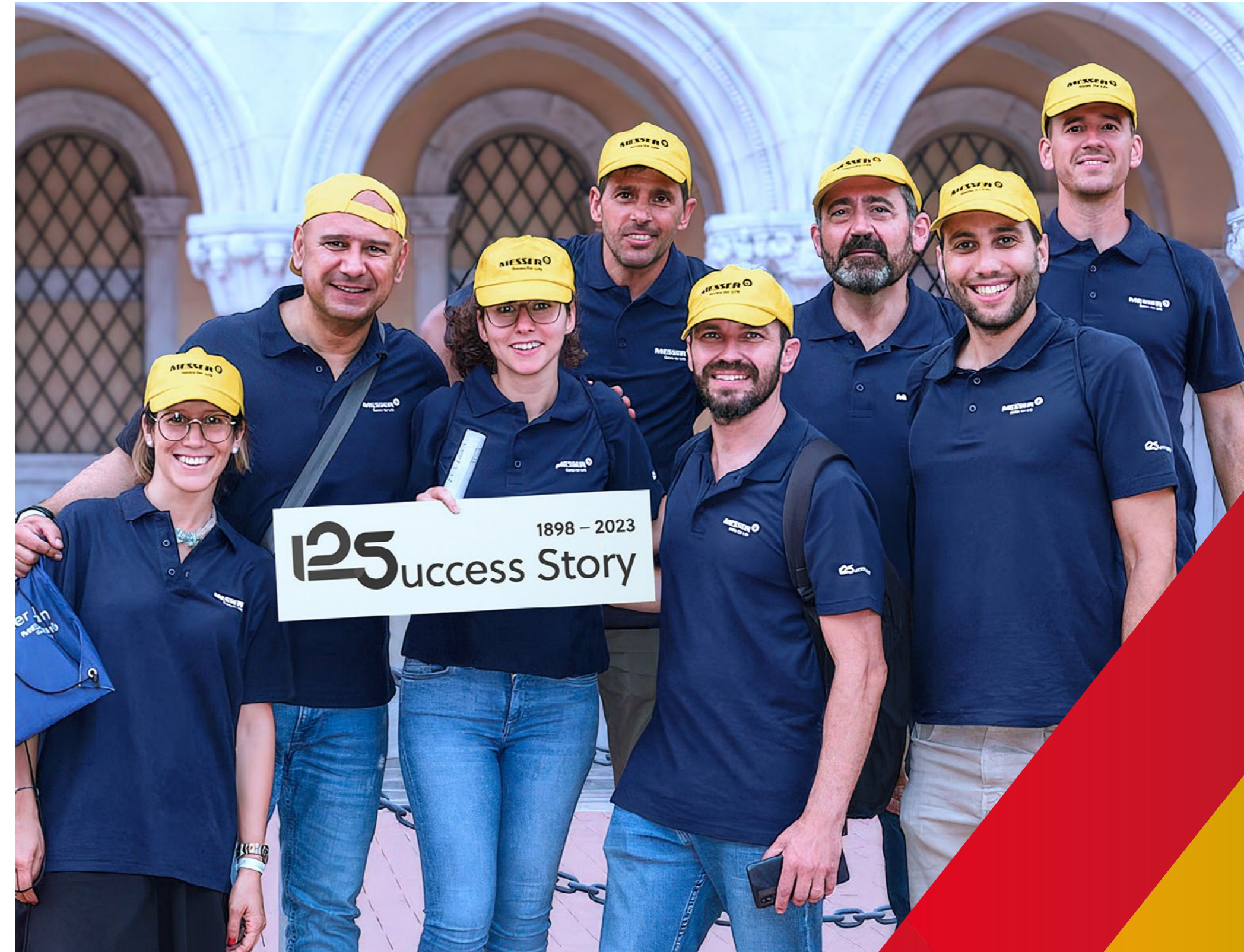
Messer in Spanien und Portugal

In diesem Bericht gehen wir auf einzelne Aktionen ein.